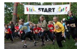
Der Start zur „Grünauer Meile“ 2012